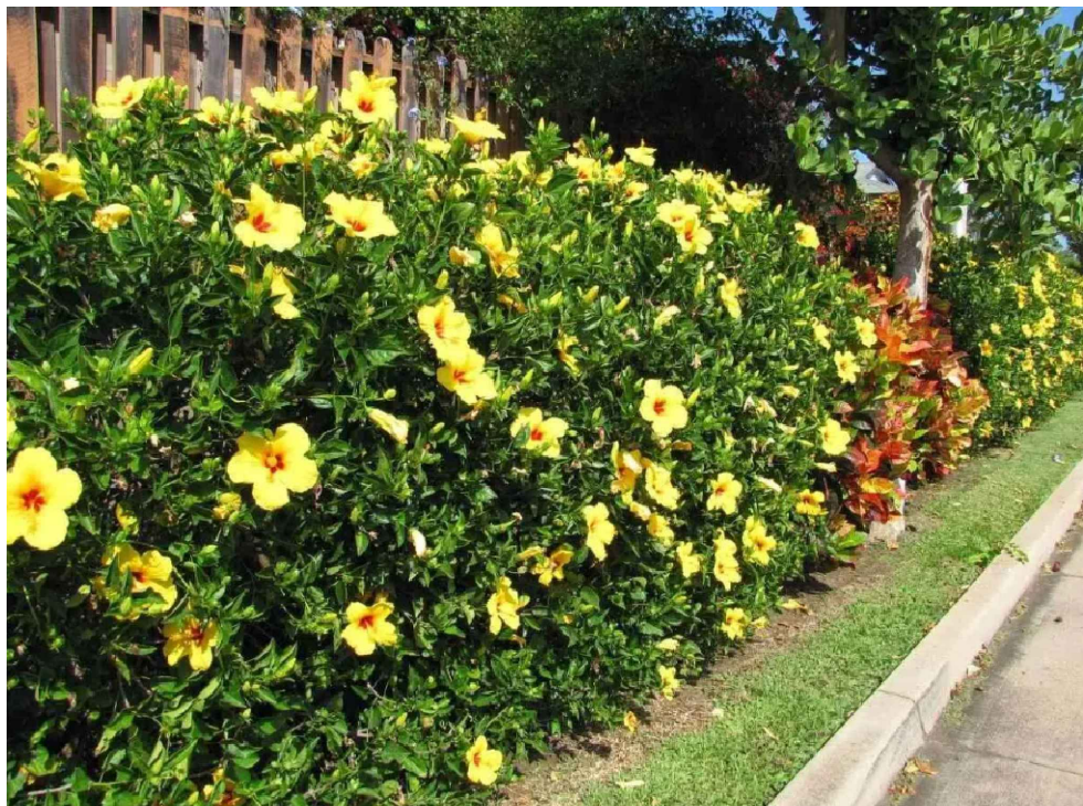
Cerca viva de Alamandra